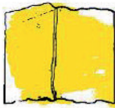
Biblioteca Municipal de Manlleu

5. Mira aquests logotips i relaciona'ls amb el que representen: